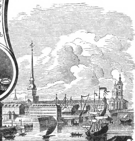
ЗИМНИЙ ДВОРЕЦЪ И ГЛАВНОЕ АДМИРАЛТЕЙСТВО ВЪ 1753 г.