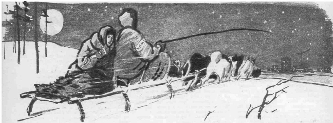
Рисунок Н. Гордейчика.

Вот когда пригодился трубный Клавын голос!