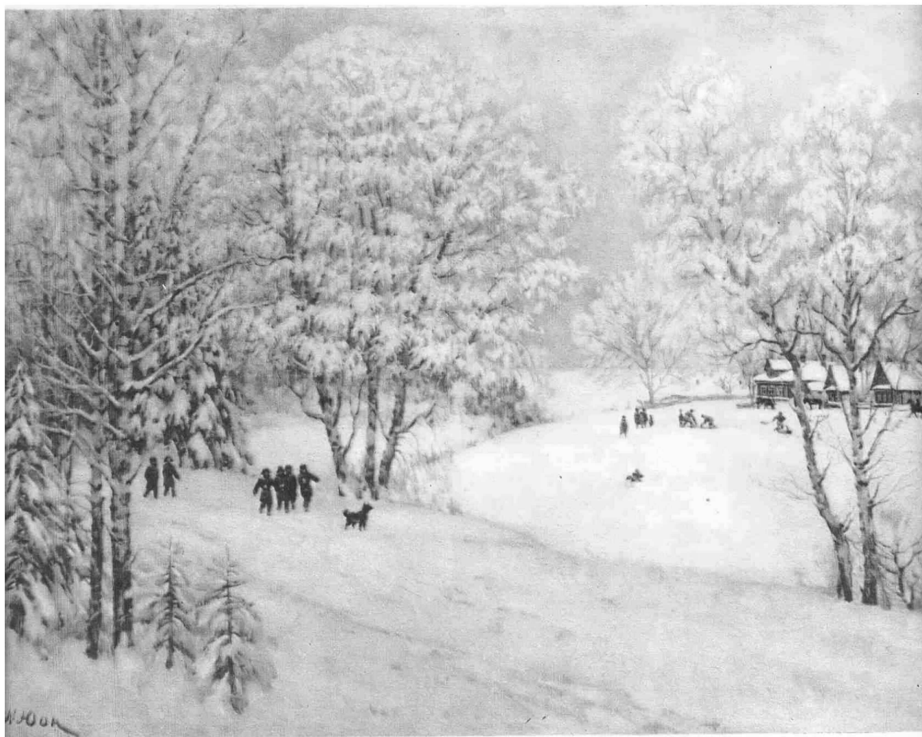
К. ЮОН. РУССКАЯ ЗИМА.