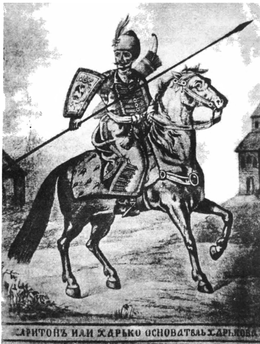
ЛЕГЕНДАРНЫЙ ОСНОВАТЕЛЬ ХАРЬКОВА—ХАРЬКО.