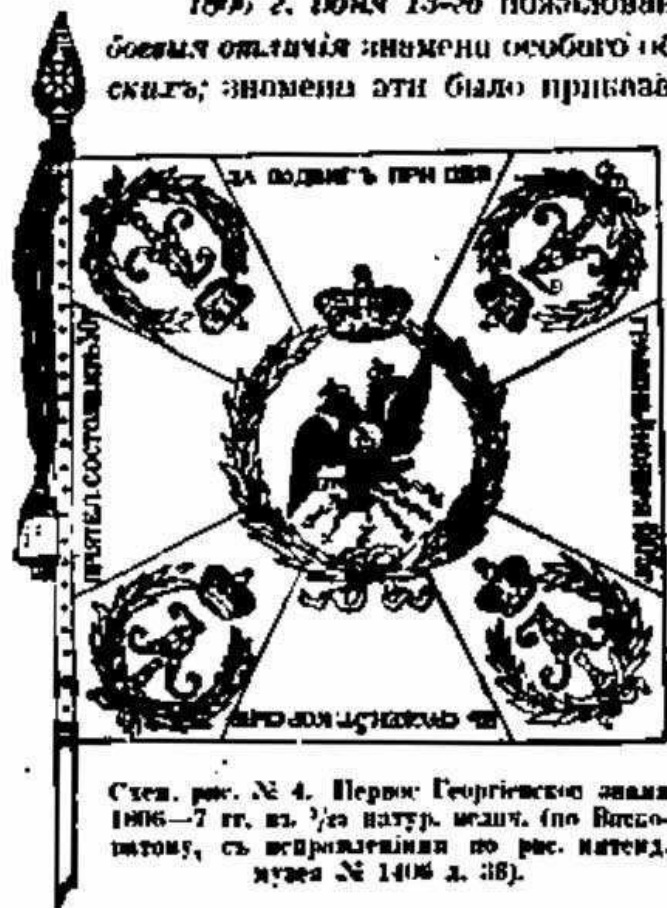
Степ. рис. № 4. Первый Георгіевскій знамя 1806—7 гг. въ \frac{3}{4} натур. велич. (по Висковатову, съ исправленіями по рис. историч. музея № 1406 л. 38).

1806 г. июня 13-го пожалована Кіевскому гренадерскому полку за боевыя отличія знамени особаго образца, получившаго названіе Георгіевскаго ; знамени эти было приказано приготовить «во всемъ сообразно съ