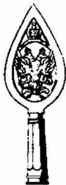
Стам. рис. № 2. Навершкіе крестоваго знамени образца 1803 г. Въ \frac{1}{4} нѣт. вѣс. (Съ подлин. навершкіа историч. Артил. музея).

Такого образца знамена получили въ указанное время мушкетерскіе полки: а) Конорскій (Линдлиндской инспекціи) съ бирзовымъ кре-