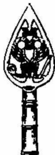
Стам. рис. № 3. Навершкіе 1797г. въ \frac{1}{4} нѣт. вѣс. (По Висковато- тову).