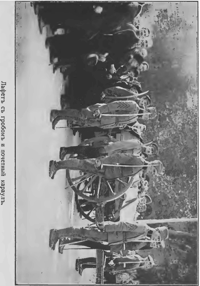
Лафетъ съ гробомъ и почетный караулъ.