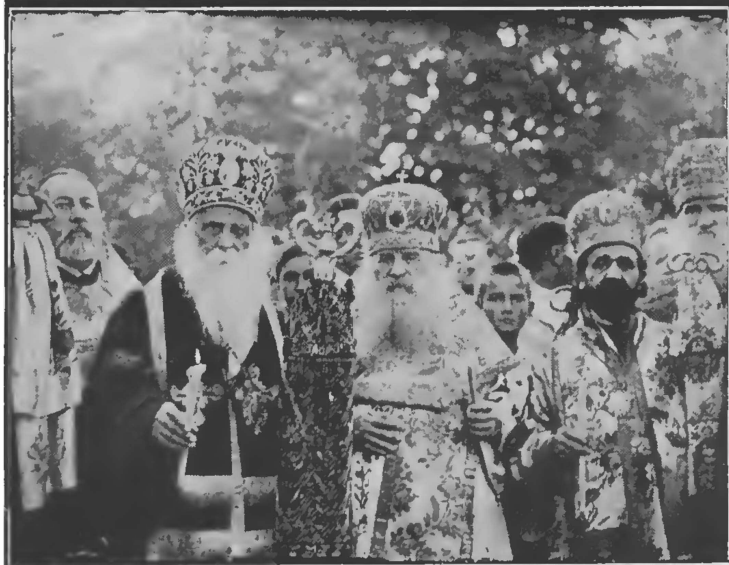
Духовенство въ процессіи. Патріархъ Сербскій Дмитрій и Митрополитъ Антоній на заупокійной литіи.