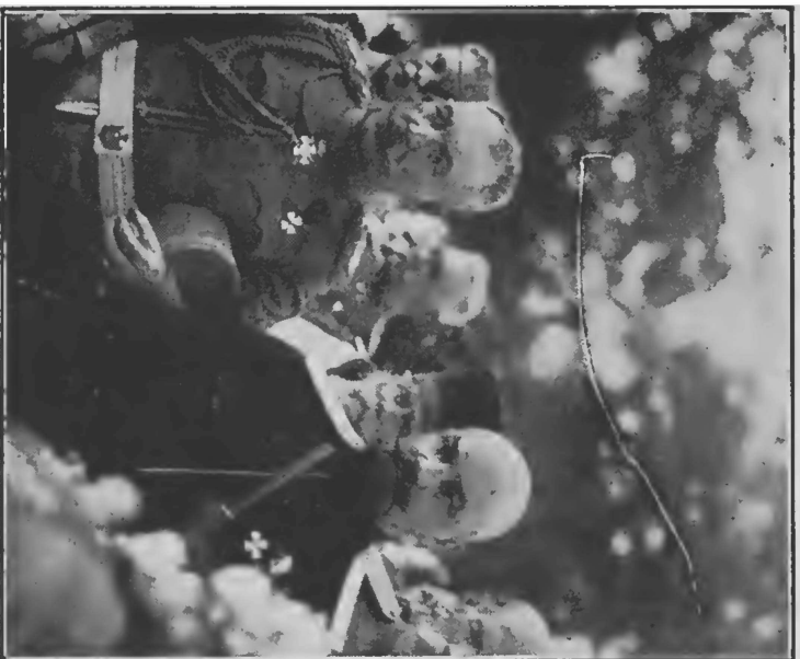
Военный Министръ Югославіи Генераль Хаджиичъ и Генераль Кутеновъ у гроба.