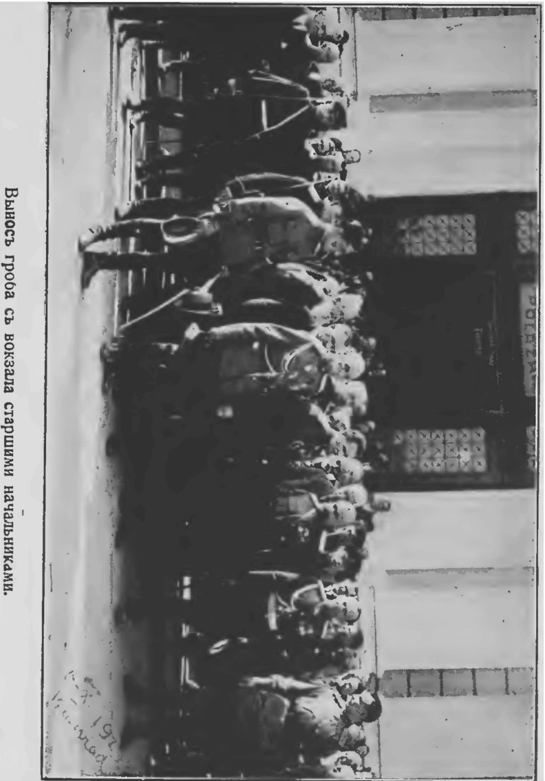
Вывозъ гроба съ вокзала старшими начальниками.