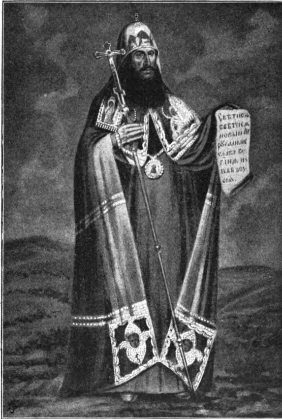
Святѣйшій патріархъ Никонъ.

клубука съ херувимами или двухъ панагій, преднесеніе креста, названіе Воскресенскаго монастыря Новымъ Іерусалимомъ и пр. Никонъ съ презрѣніемъ и ироніей отвѣчалъ