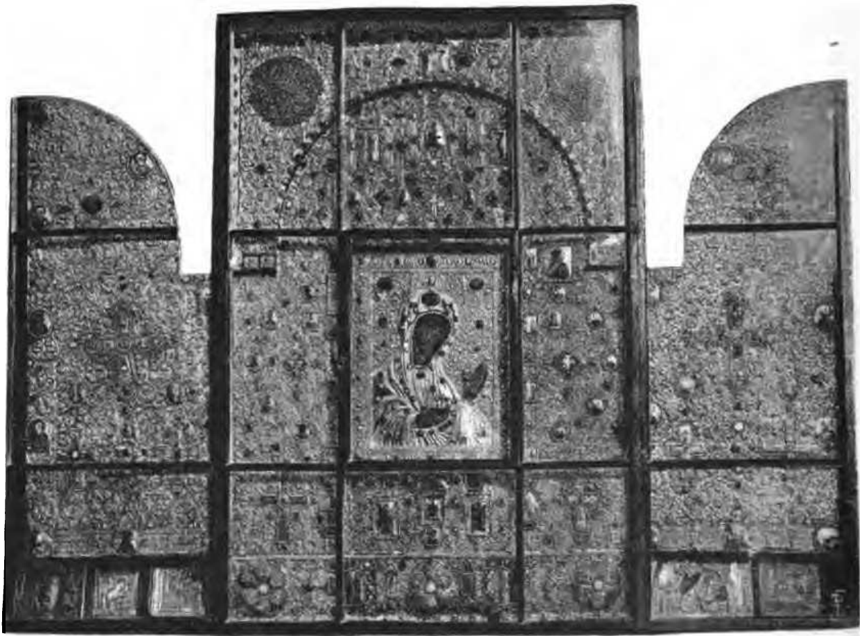
1. Общій видъ Хахульской иконы Богоматери въ Гелатѣ.

1. Икона Божіей Матери, называемая Хахульская, происходящая по преданію изъ селенія Хахули, на рѣкѣ Тортумѣ, въ предѣлахъ турецкой Грузіи. Икона имѣетъ форму триптиха или тройнаго складня, имѣетъ съ крыльями въ ширину