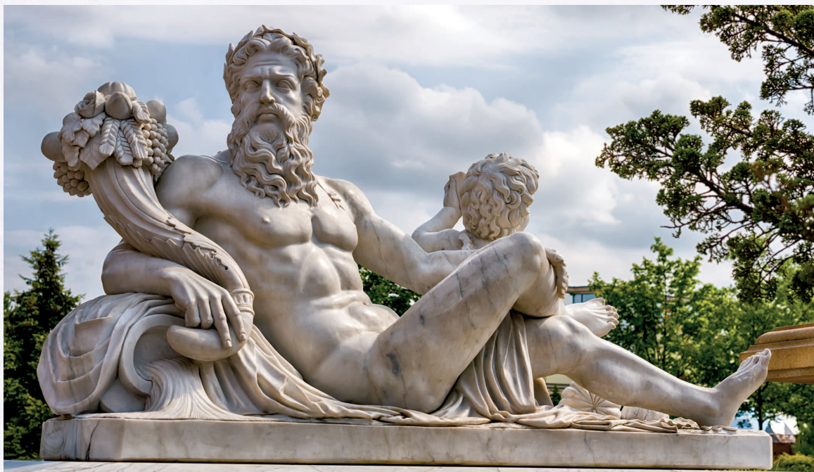
Другая статуя, посвященная богу Зевсу

В честь победы Зевса над Кроносом были учреждены Олимпийские игры. Зевс был достоин только самых дорогих да-