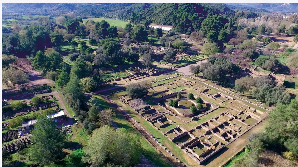
Вид на Олимпию с высоты птичьего полета

Олимпия никогда не была городом в современном понимании этого слова.