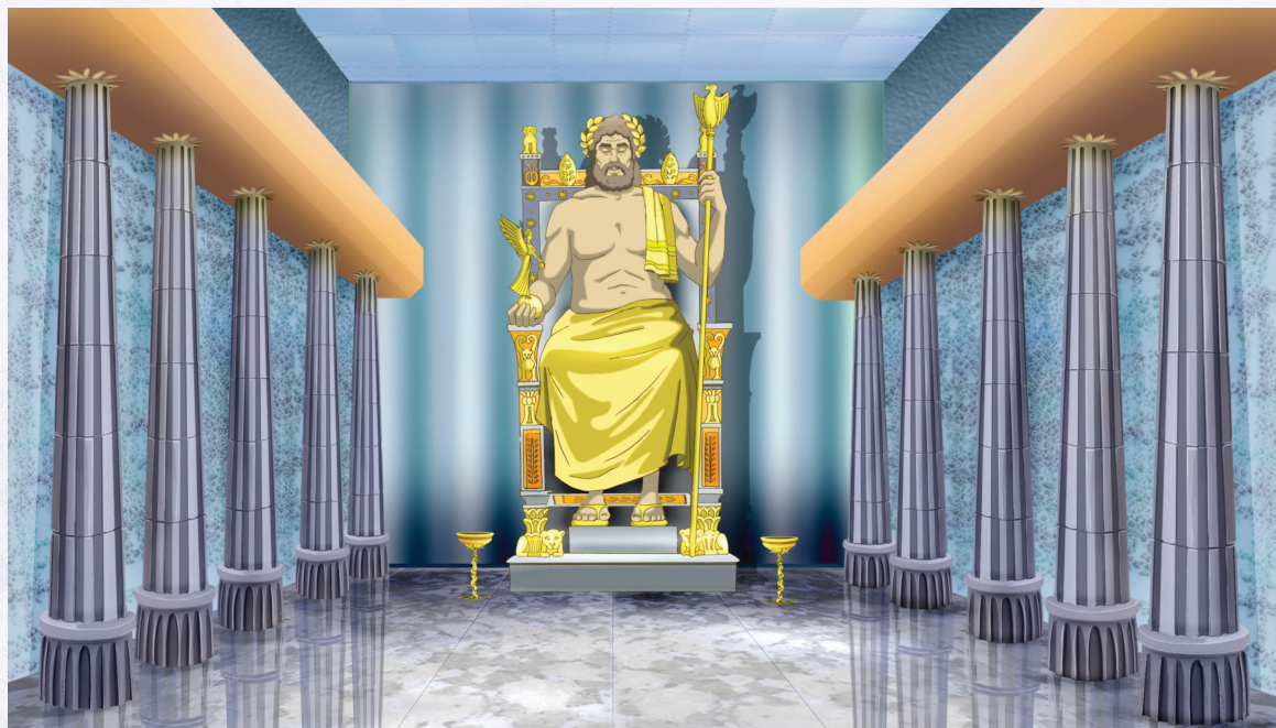
Третье чудо света

И пусть статуя Зевса не дожидается наших дней, а от некогда величественного храмового комплекса остались одни развалины, городок Олимпия и в наши дни ежедневно привлекает сотни туристов. Это один из самых крупных археологических центров древности. Здесь вы сможете и прогуляться по священной роще Алтис, и увидеть камни, знакомые с секрета-