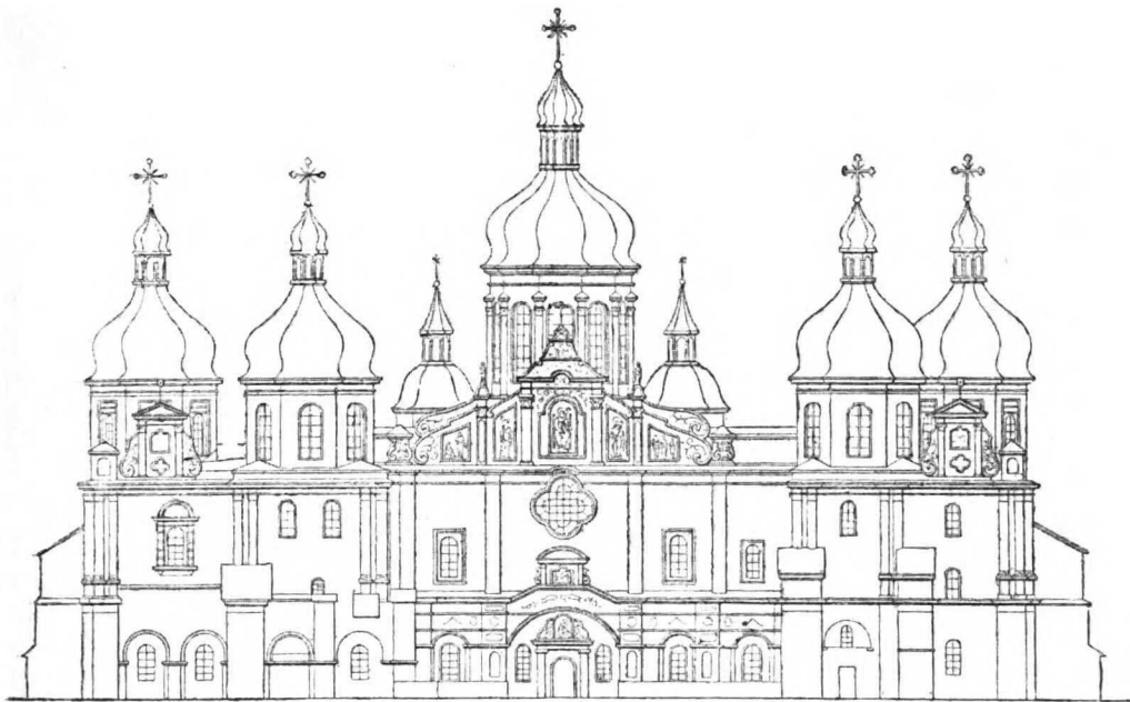
Рис. 1. Софійскій соборъ въ Кіевѣ.