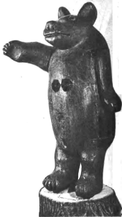
Рис. 11. Улей в виде фигуры медведя. Начало XIX в.

Богородская игрушка известна всему миру. Это небольшие скульптурные фигурки людей, животных, птиц, вырезаемые из липовой чурочки, так называемого «трехгранника», т. е. из четвертинки расколотого вдоль на четыре части липового полена. Фигурки укреплены на подставочках по две, по три и нередко составляют вместе какую-либо забавную сценку. С помощью нехитрого устройства — пружинки, скрытой в подставке, подвесного груза-баланса или раздвижных планок фигуркам сообщается движение. Постоянным и любимым героем богородских игрушек является на все готовый и все умеющий Мишка-медвежонок. Он и на велосипеде ездит, и на музыкальных инструментах играет, учит детей, занимается строительством, сажает деревья, продает лотерейные билеты и даже летает в космос. Например, большую известность приобрела в свое время игрушка на пружинке «Медведь фотографирует луну». В ней при нажимании на кнопку и сжатии пружинки в подставке лунный серп поворачивался