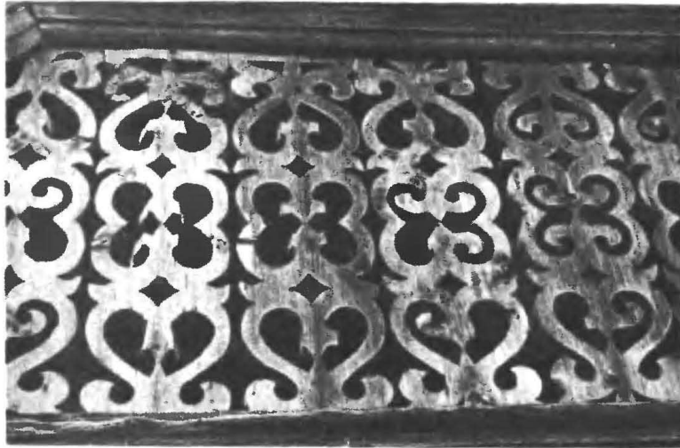
Рис. 4. Образец домовой ажурной резьбы XIX в.

гоградской и даже Московской областей, введенные в 30-е, 50-е и даже 70-е годы. В лучших образцах этой современной резьбы можно увидеть те же солнечные диски, тех же птиц и драконов.