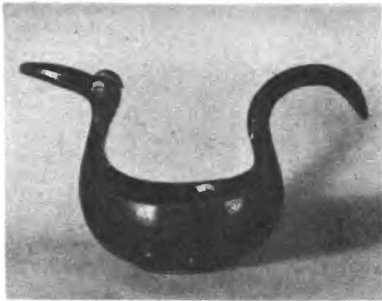
Рис. 10. Деревянный ковш-утица. XIX в.

скульптурки-игрушки, которые продавались, например, у стен Троице-Сергиевского монастыря (г. Загорск). Как известно по документам, их покупали там для Петра I, когда он был ребенком. По-видимому, производство резных деревянных игрушек было широко распространено в том районе. Отсюда берут начало современные производства: Богородская фабрика художественной резьбы по дереву и Загорская фабрика игрушки.