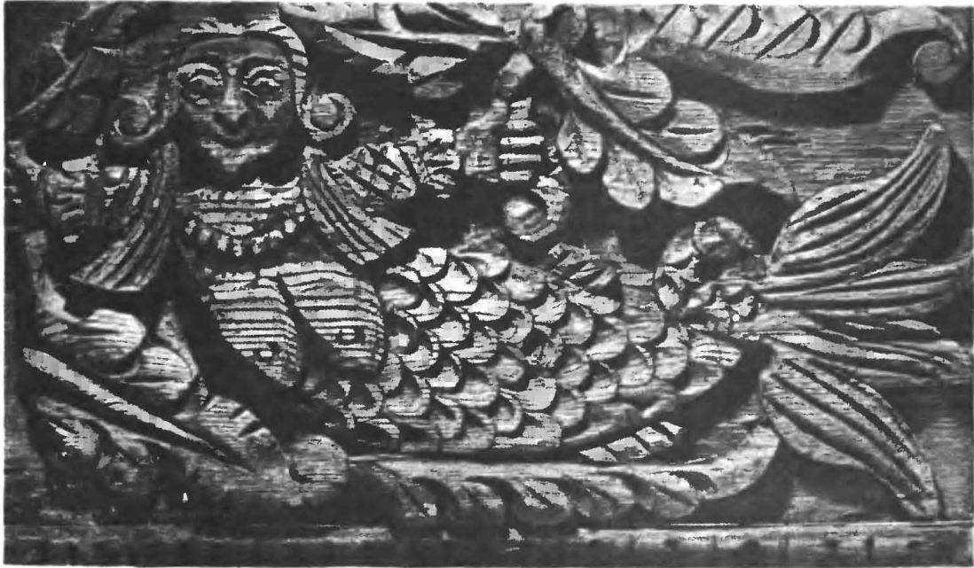
Рис. 3. Образец домово́й (корабельной) резьбы — «Русалка-берегняя». Конец XVIII — начало XIX в.

Несмотря на свои достоинства, эта резьба уже не была такой сложной, как на горьковских причелинах. В наше время резные украшения делают крайне редко, в исключительных случаях. Однако опытный мастер-резчик должен владеть всеми видами резьбы, в том числе и теми, которые применяются крайне редко. Может случиться, что его мастерство потребуется для осуществления какого-либо исключительного заказа или при оформлении уникального сооружения, наконец для восстановления и реставрации старинного памятника русской архитектуры.