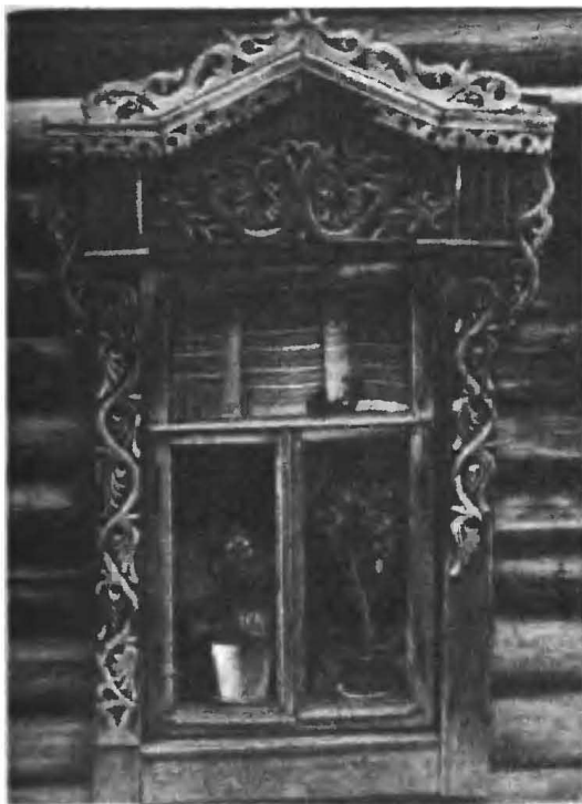
Рис. 2. Наличник, украшенный резьбой. Конец XVIII — начало XIX в.