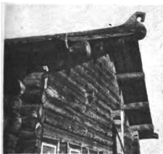
Рис. 1. Охлупень в виде полуфигуры коня. Конец XVIII — начало XIX в.