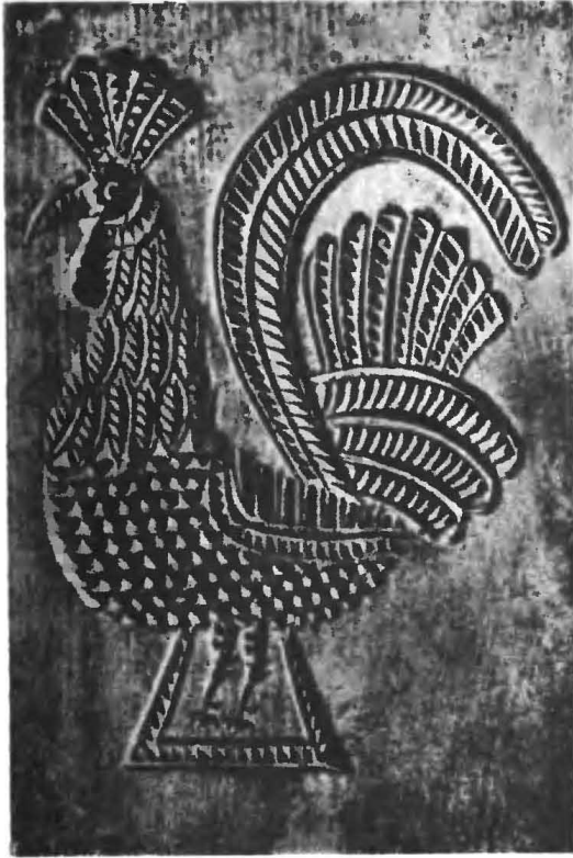
Рис. 7. Принципная доска с изображением петуха XIX в. Геометрическая трехгранновыемчатая, скобчатая, контурная резьба

до самой своей смерти оставался крупнейшим русским народным мастером-художником в области плоскорельефной резьбы по дереву.