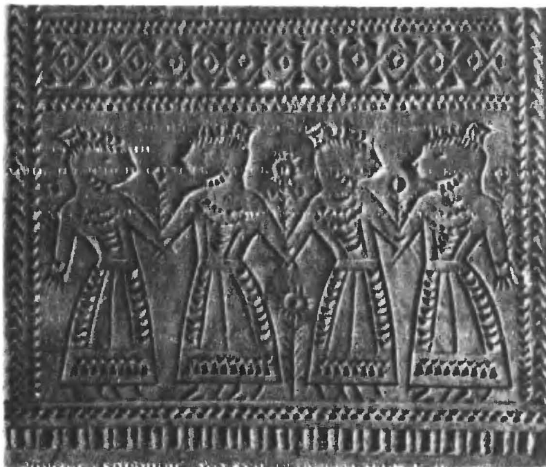
Рис. 6. Деталь Ярославской теземковой чрепки. Начало XIX в. Контурная, ногтевидная резьба