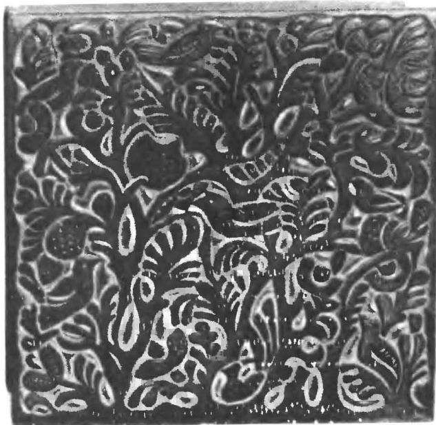
Рис. 9. Образец пальчатой, ворноскольской резьбы. Начало XX в.